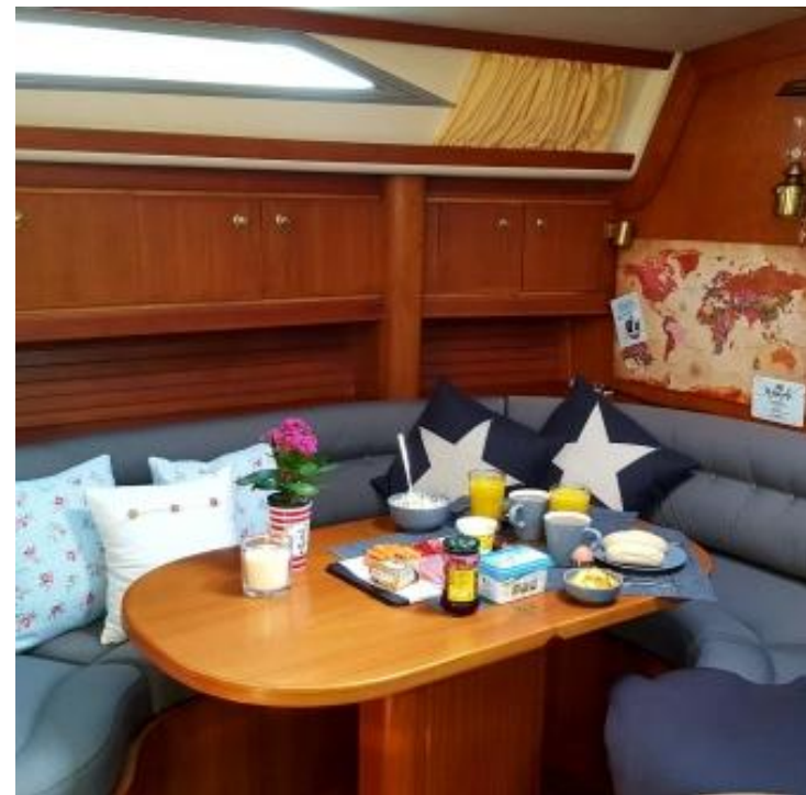
Salon und Pantry