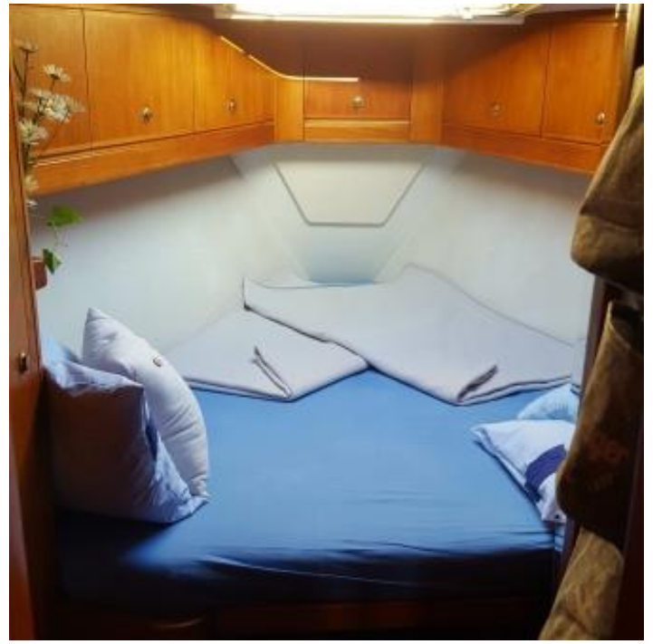
Bugkabine und Gästebad