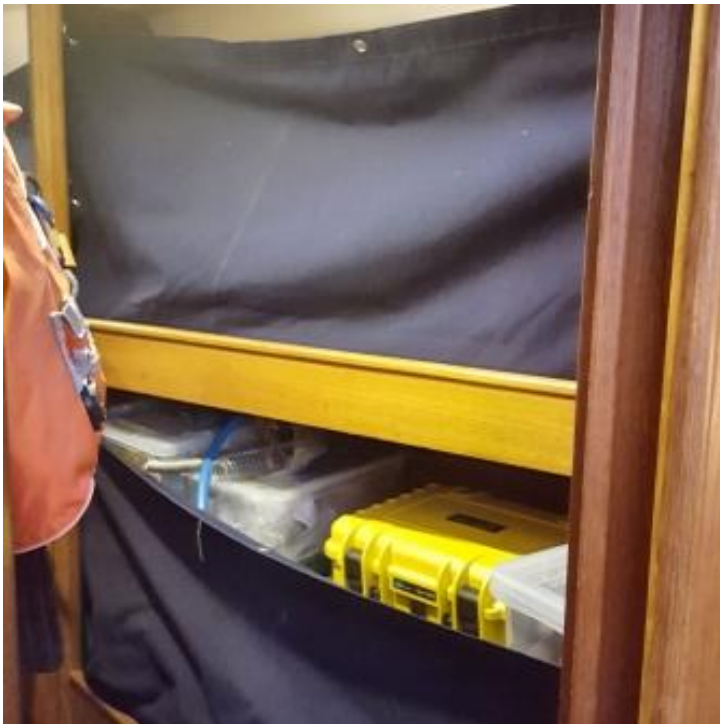
Doppelstockkabine: Aktuell als Material-Kabine genutzt und mit Leesegeeln gesichert.