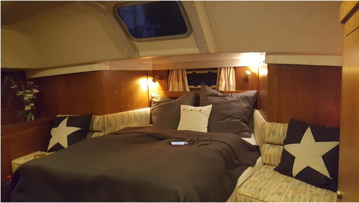
Masterkabine und Masterbad